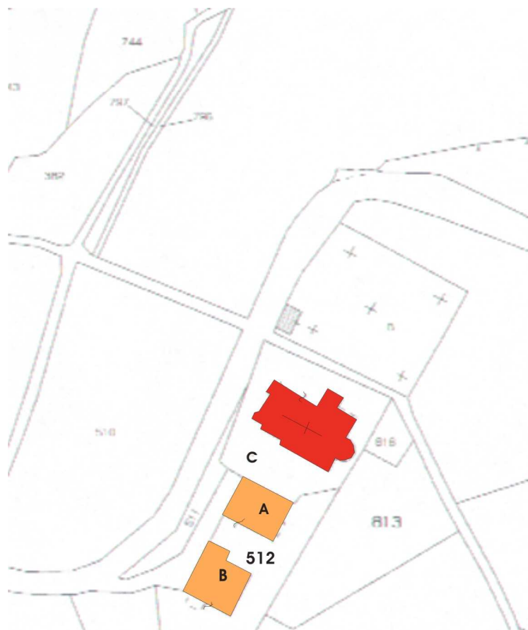
Stralcio di mappa catastale